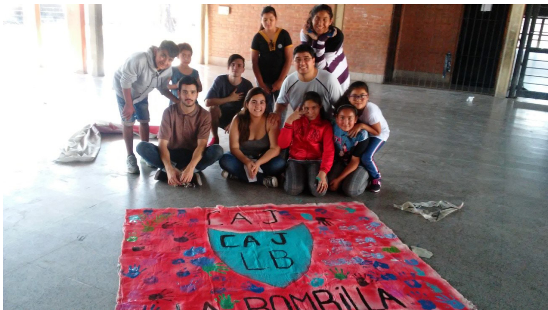
Escuela Técnica "Juan XXIII" | B° La Bombilla