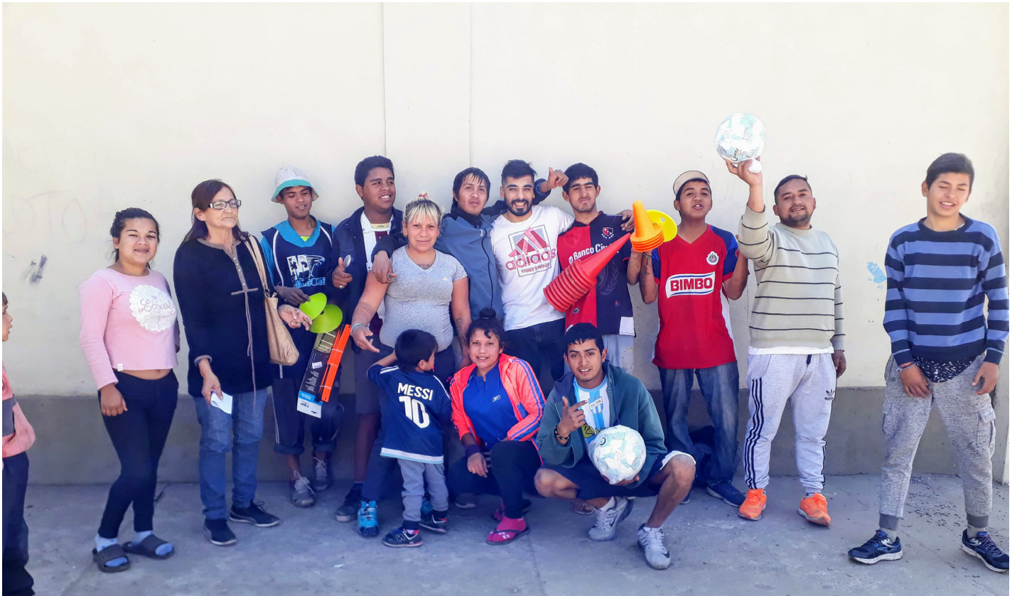
Comedor Casa de los Pibes | B° El Sifon

Estamos trabajando en una comunidad que comenzó a organizarse a inicios del siglo XXI, cuando la recetas neoliberales promovieron la crisis del 2001, cuando el capitalismo dejó de "caretearla" y mostro su lado más real y más salvaje. ¿Cuál fue el saldo? Devaluación, hambre, muerte. "Cuando no hay opción el pueblo sufre y se la banca" cita una canción de León Gieco. Pero además de bancársela, también algunas veces el pueblo se levanta ¿el saldo de la insurrección? No sólo un presidente yéndose en helicóptero, sino también comunidades organizadas, conquistas sociales, ampliación de derechos... Empezamos recordando esto, no sólo porque siempre hay que tener memoria para saber a dónde ir, sino porque los escenarios políticos actuales son similares, nuevamente las políticas de ajustes apuntan a los sectores populares, la culpa de la inseguridad es de los pobres y no de la pobreza, los nefastos son los adictos y no los narcos, la solución es la policía y no la educación e inclusión. Lo que nos enseñó el trabajo comunitario es la since-