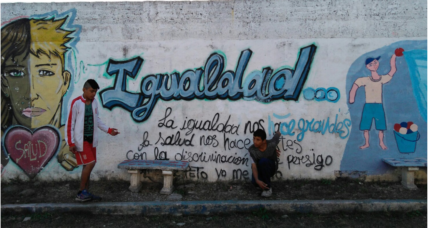
CIC "Creadores de Esperanza" | B° Bombilla