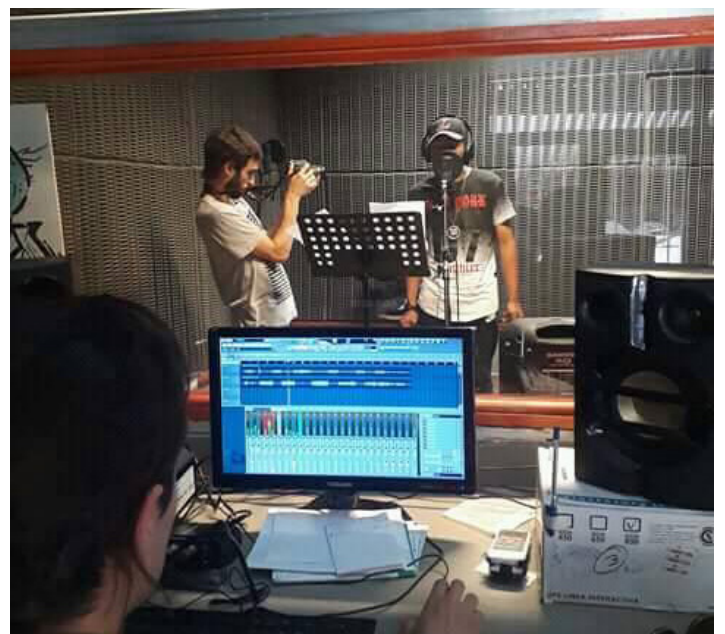
Ingenio Cultural | Min. de Desarrollo Social