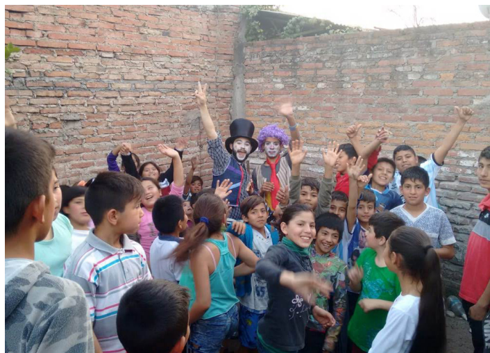
Merendero "la porteña" | B° La Bombilla