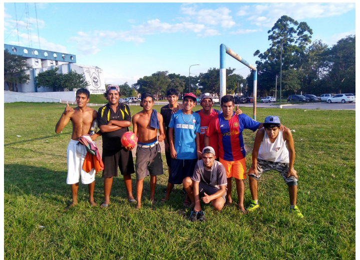
Equipo de Futbol Los Lapachos | B° La Bombilla