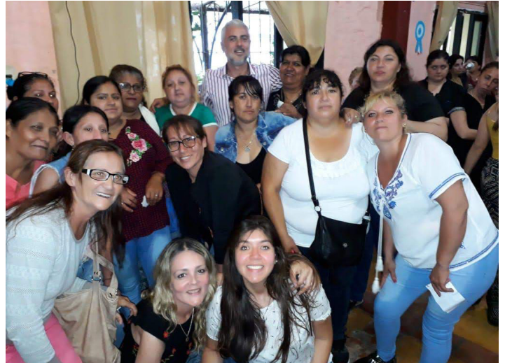
Dirección de Políticas Alimentarias | B° El Sifón