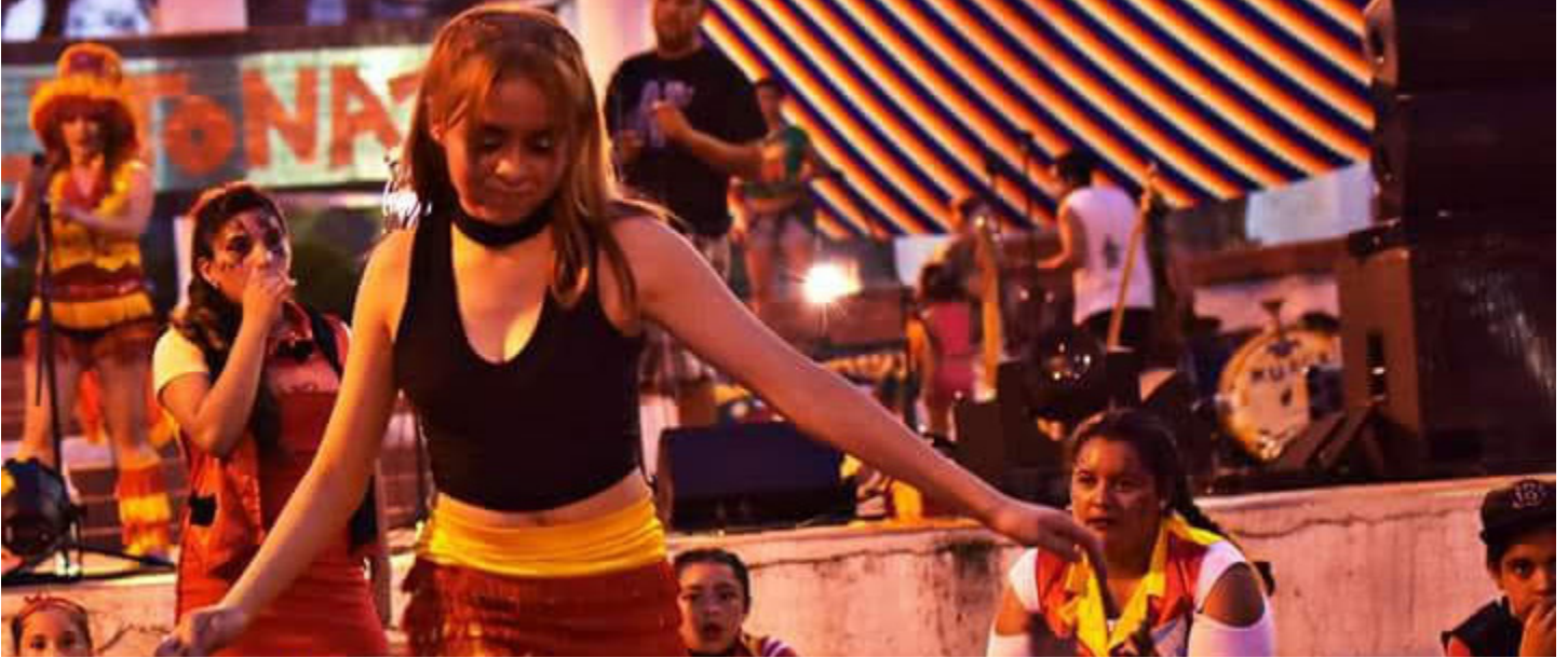
Pileton parque Avellaneda | San Miguel de Tucumán

“Los Toca fondo”, nacieron en el barrio “La Bombilla”, cumplieron 12 años en el mes de agosto. Desde hace más de una década que esta murga barrial existe y se mantiene a puro pulmón. Los ingresos de la misma para poder funcionar son mediante el aporte de sus propios integrantes, rifas o dinero recaudado por sus presentaciones artísticas.