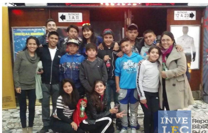
Cine Atlas | San Miguel de Tucumán