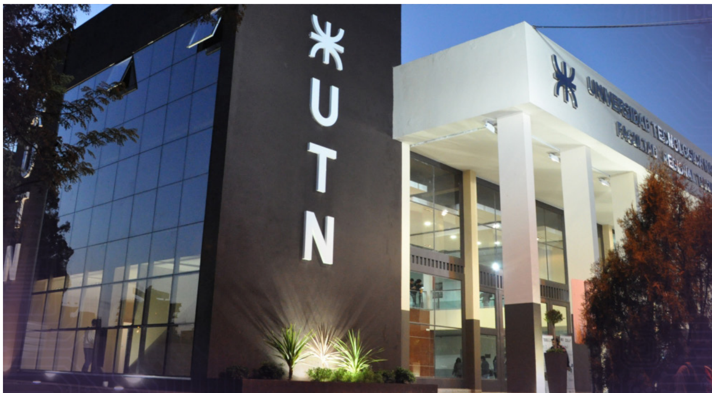
Universidad Tecnológica Nacional - Facultad Regional Tucumán | San Miguel de Tucumán

Desde hace unos años que venimos trabajando desde la Universidad Tecnológica Nacional en una tendencia para acerca la Universidad a los Barrios, en principio mediante proyectos de presupuesto nacionales y propios se realizó en el Barrio El Sifón la creación y reparación de dos espacios verdes, donde se finalizó a principios de 2018 dos plazas en zonas estratégicas de la comunidad con juegos para niños, iluminación etc. además pudimos colaborar a la asociación civil los lapachos con su proyecto propio de radio comunitaria y en agosto del 2018 se realizó la entrega de los equipos necesarios para el funcionamiento de la emisora de radio local "nuestra voz".