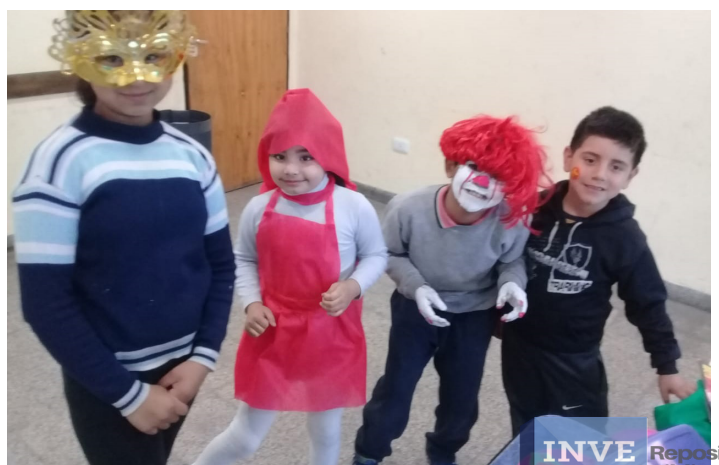
CIC Creadores de Esperanza | B° La Bombilla