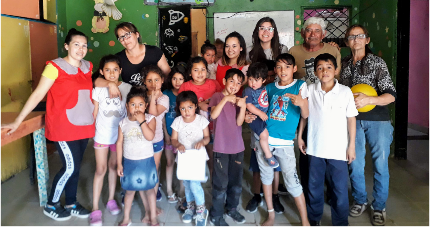
Comedor Infantil Los Lapachos | B° El Sifón

En el Comedor Infantil Los Lapachos ubicado en el barrio Juan Pablo II, mas conocido como "el Sifón", perteneciente a la Asociación Civil Los Lapachos Tucumanos, contamos con almuerzo, merienda y cena. Diariamente asisten aproximadamente 45 familias, siendo la mayoría niños. Sin embargo, Los Lapachos no es solo un lugar donde los chicos comen, sino también un espacio de recreación, contención y confianza.