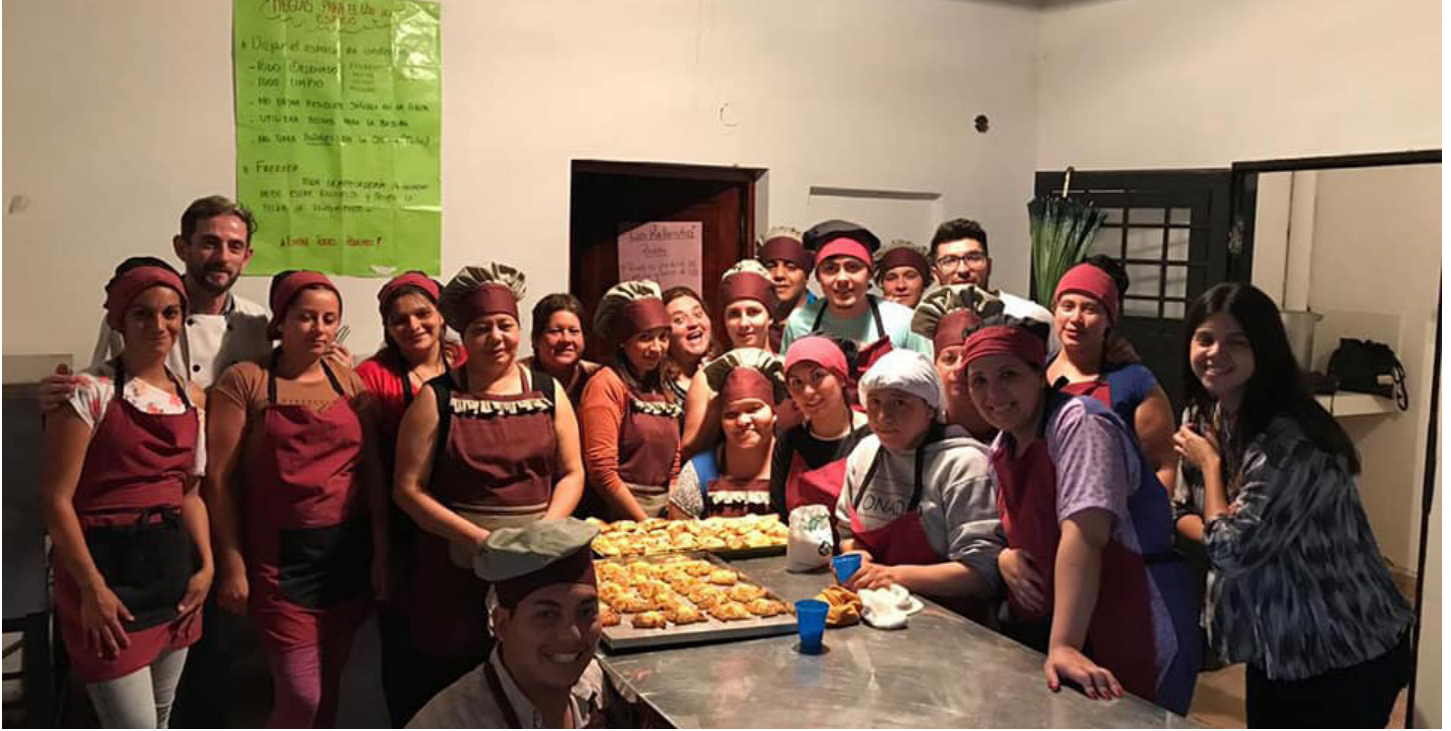
Casa de los Pibes | B° El Sifón