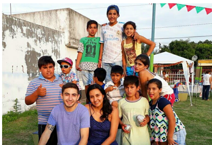
CIC Creadores de Esperanza | B° La Bombilla

El espacio de adolescencia de Abordaje Territorial tiene como objetivo promover una adolescencia saludable, participativa y solidaria. De esta manera se posibilitan oportunidades para el desarrollo del autoconocimiento y la construcción de miembros comprometidos y sensibles de la sociedad. Desempeñamos nuestras actividades en los Barrios Juan XXIII los días Martes, Miércoles y Viernes, los días Jueves en Barrio Alberdi Norte. Para mas información visita nuestra página de face Abordaje Territorial o en el Cic Creadores de Esperanza (Perú y San Miguel)