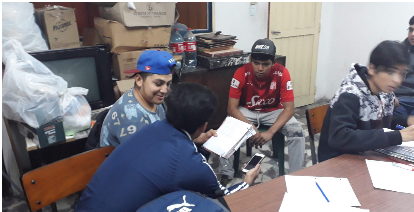
Esc. Solidaridad y Paz | B° La Bombilla