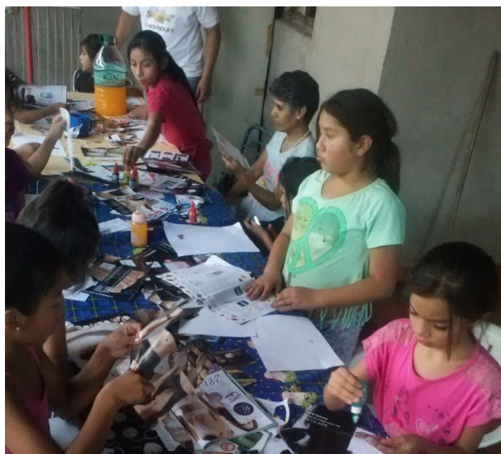
Merendero "la porteña" | B° La Bombilla