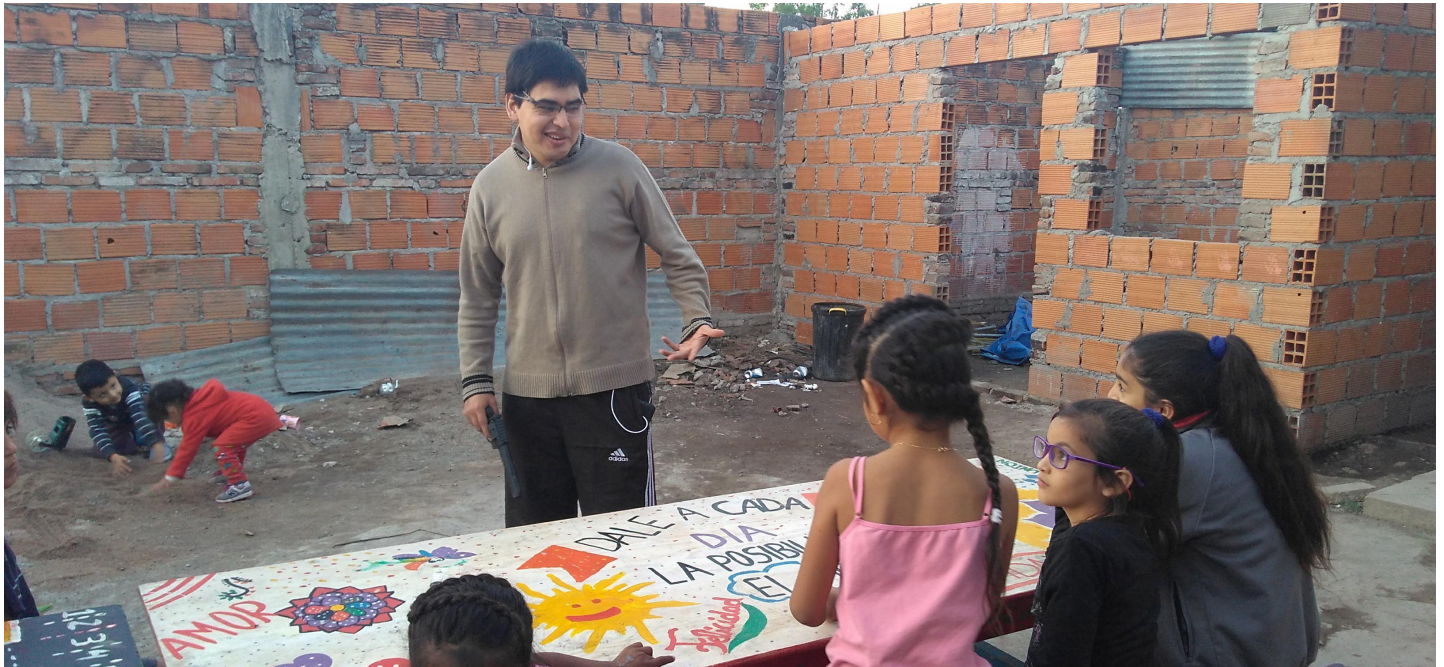
Merendero "Carita de Esperanza" | B° La Bombilla