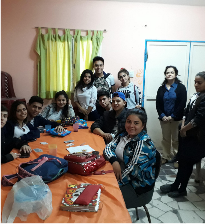
Esc. Solidaridad y Paz | B° La Bombilla