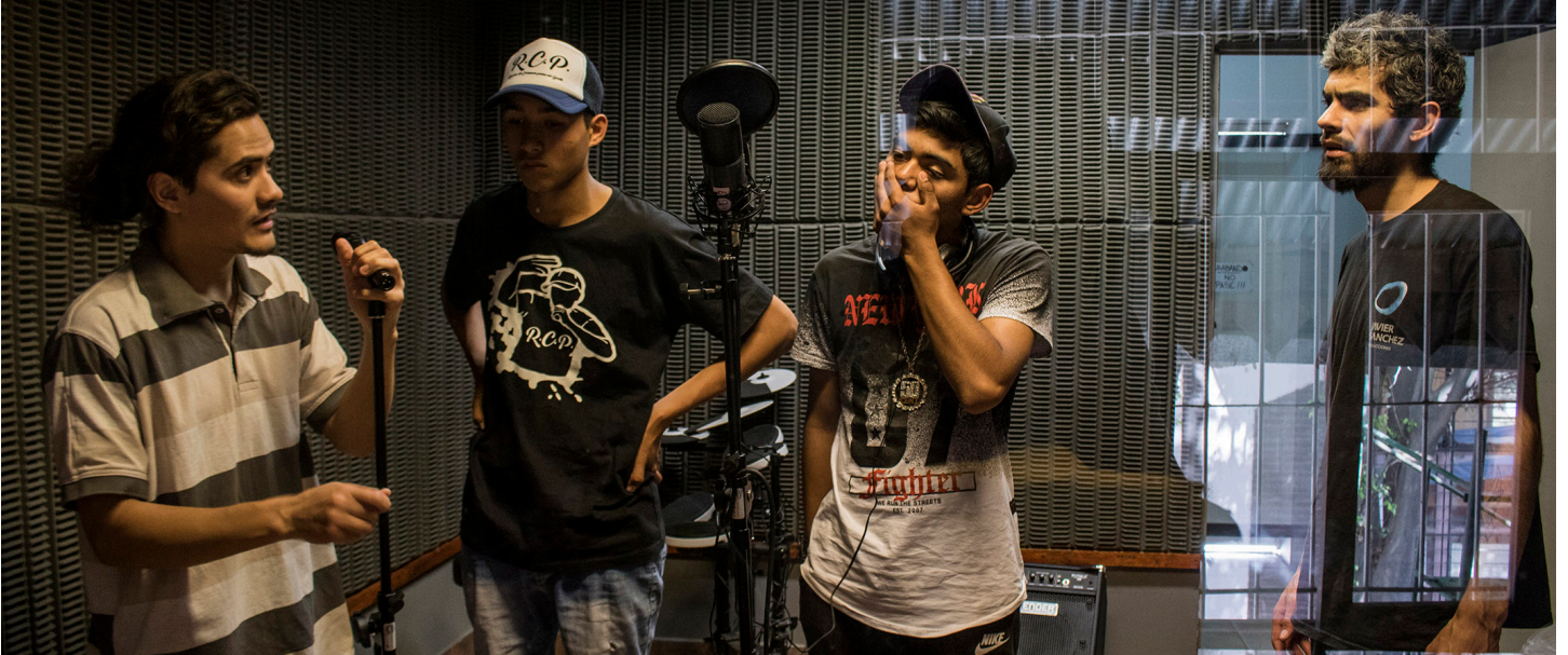
Ingenio Cultural | Min. de Desarrollo Social