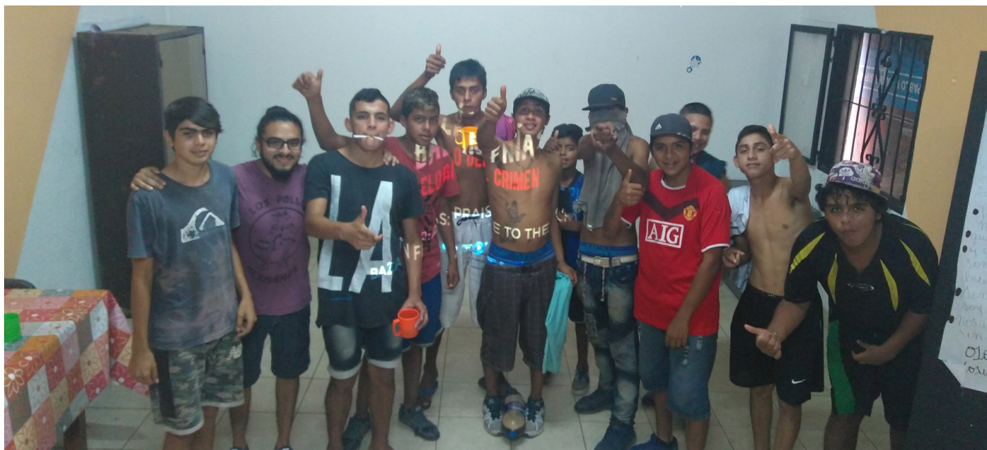
Presentación de la película en "la casa de los pibes" | B° El Sifón