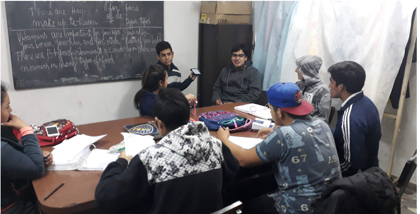
Esc. Solidaridad y Paz | B° La Bombilla