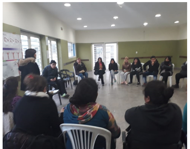
CIC "Creadores de Esperanza" | B° La Bombilla