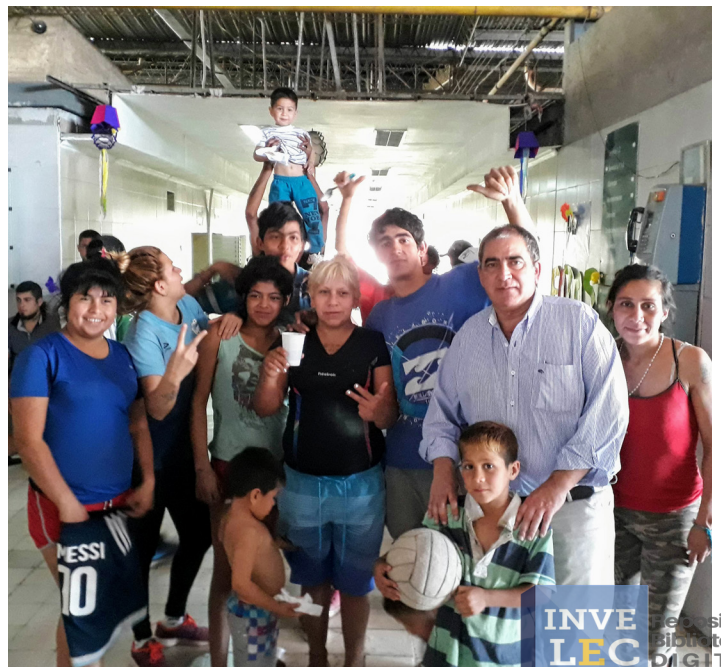
Hospital Obarrio | B° El Sifón