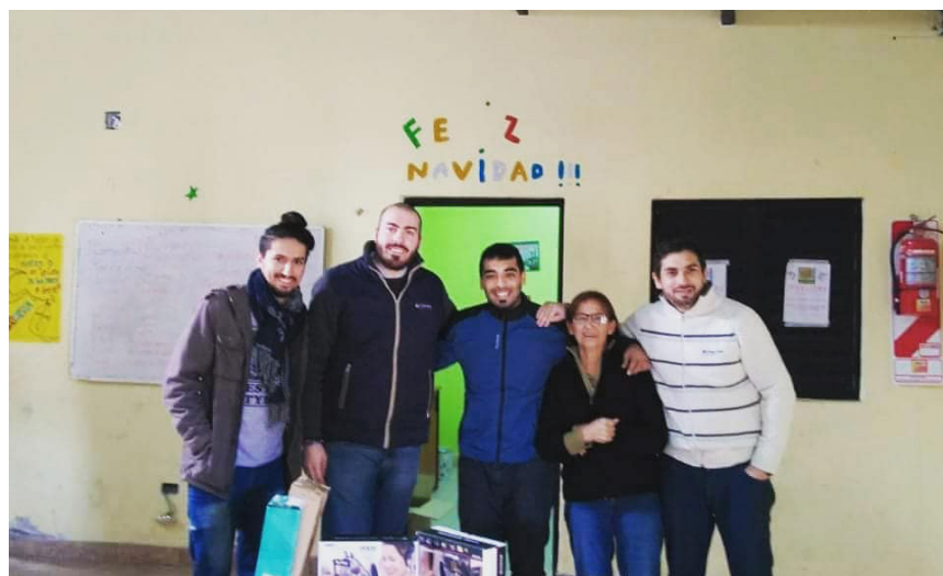
Casa de los Pibes | B° El Sifón