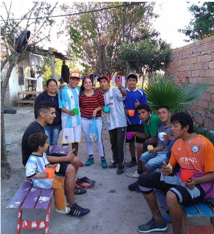
Merendero Carita de Esperanza | B° La Bombilla