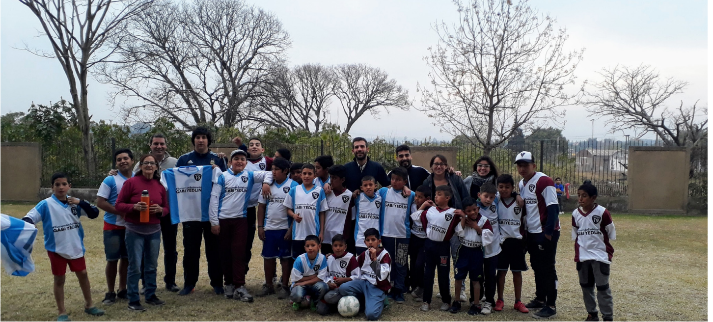
Equipo de futbol "Los Lapachos" | B° El Sifón

El futbol nos atraviesa a todos y en el barrio es incluso más compleja su incidencia, y nos interpela tan profundamente en nuestras vidas que aparecen la política, la miseria, el racismo, la xenofobia, la discriminación a las mujeres. Todos los grandes temas que tocan a nuestra sociedad hoy se ven reflejados en el futbol. Sin embargo, no compartimos esta mirada Neo liberal de un deporte que por naturaleza es solidario y en esencia colectivo.