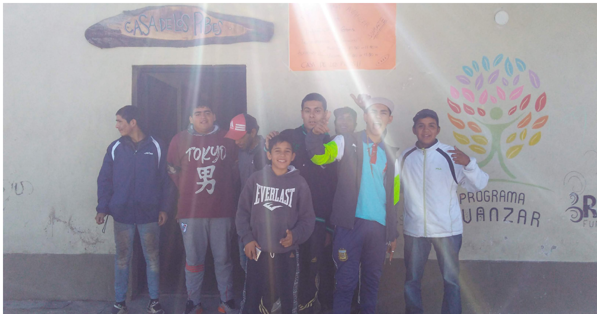
Casa de los Pibes | B° El Sifón

El comedor de la “Casa de los Pibes” comenzó a funcionar el 4 de Julio del 2017, el cual es una articulación entre Políticas Alimentarias, Programa “Avanzar”, Sec. de Adicciones y la Asociación Civil Los Lapachos Tucumanos.