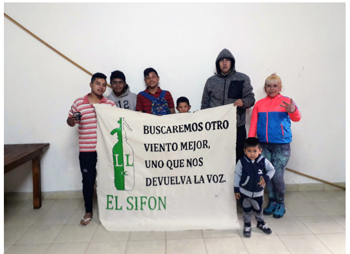
Comedor Casa de los Pibes | B° El Sifón