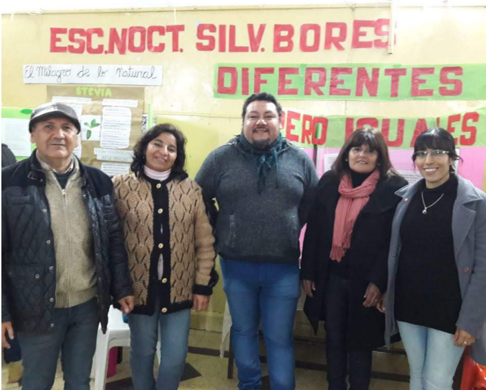
Esc. Silvano Bores | B° El Sifón