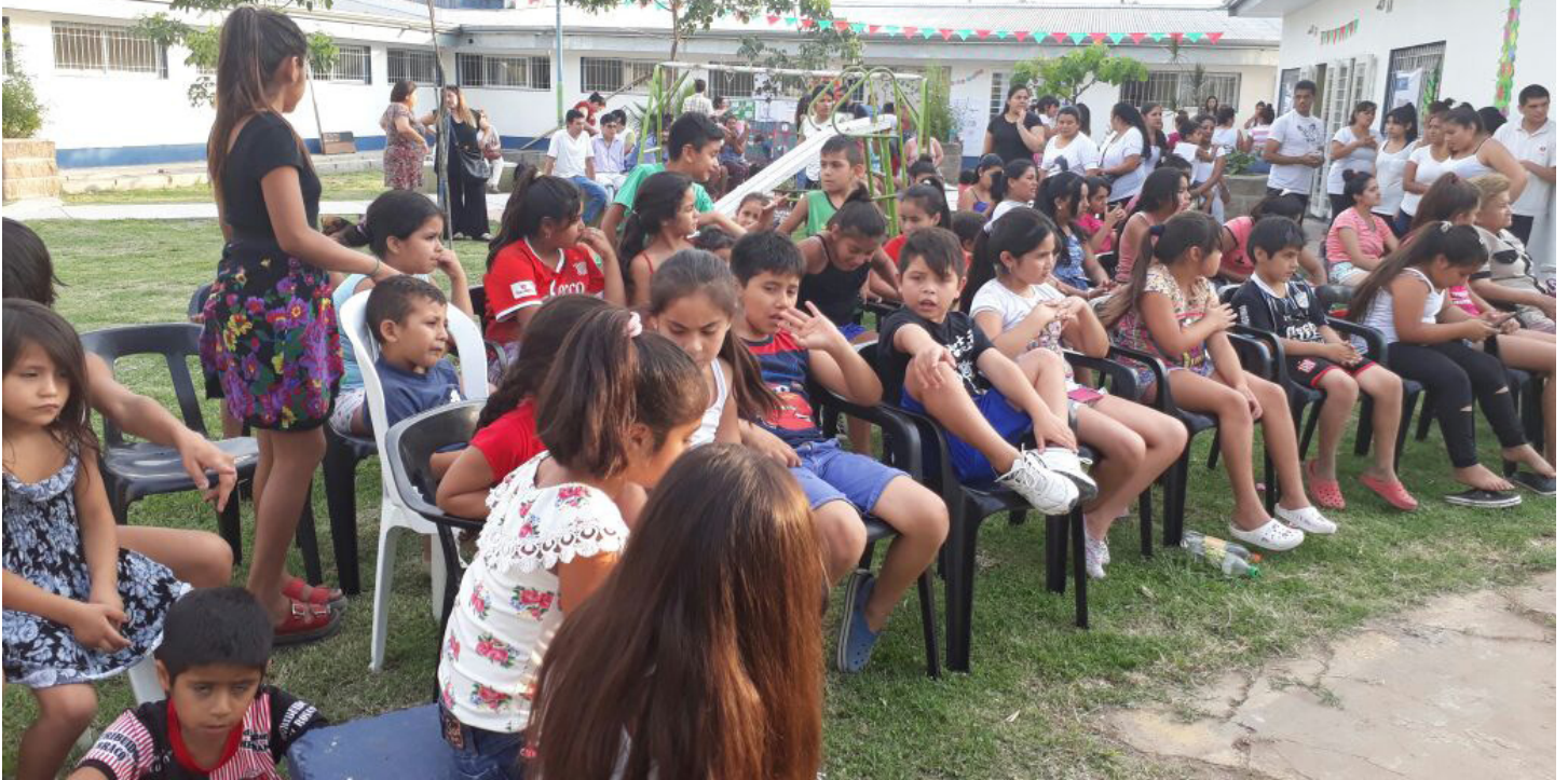
CIC "Creadores de Esperanza" | B° La Bombilla

La mesa de gestión local que funciona en el CIC creadores de esperanza, está integrada por referentes de los barrios Juan XXIII, Juan Pablo II, El Bosque y Villa Muñecas n°3, acompañada por técnicos de provincia y nación, se reúnen los días martes cada 15 días, a las 09:00 horas en el CIC (San Miguel esquina Perú).