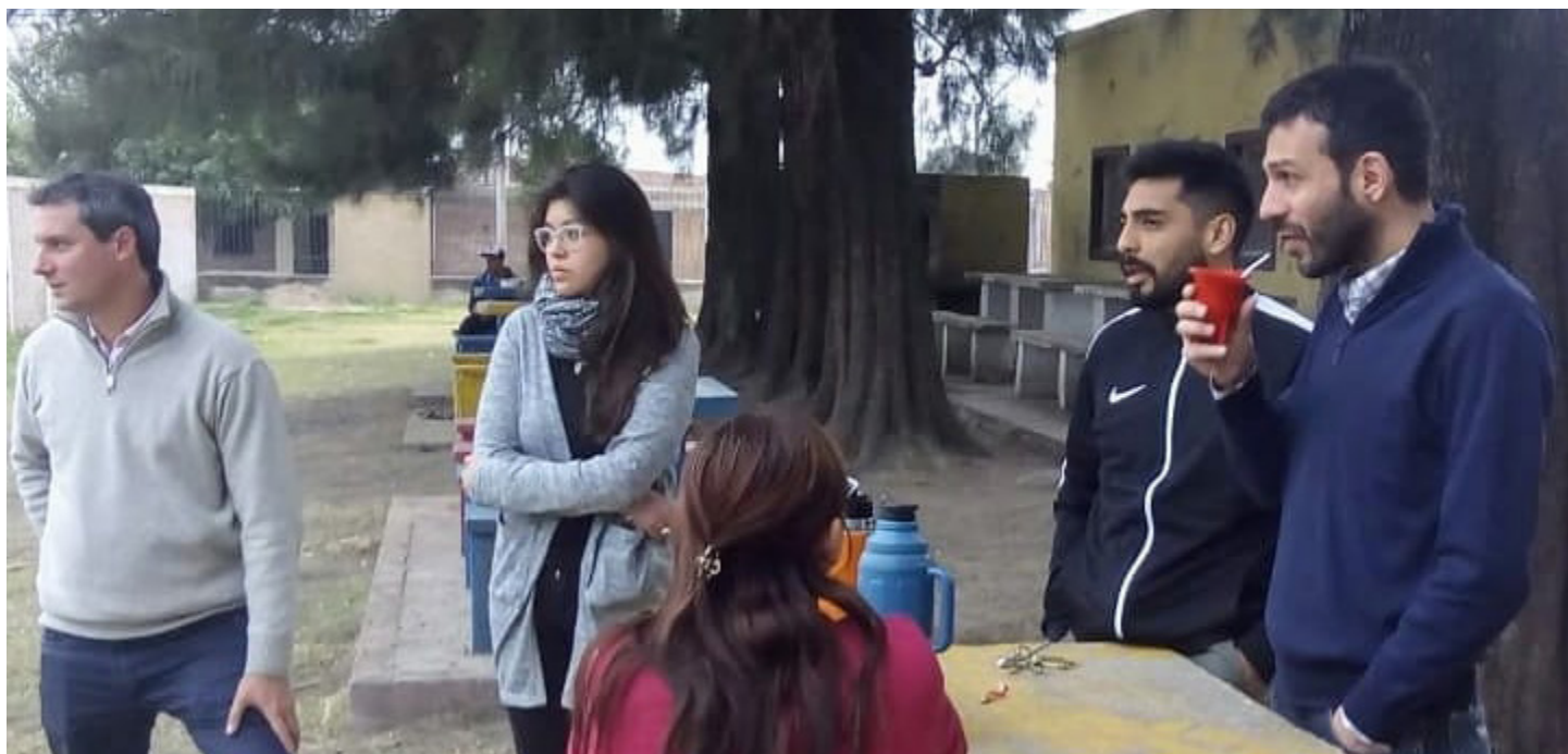
Hospital Obarrio | B° El Sifon

La Secretaría de Prevención y Asistencia de las Adicciones tiene como misión entender, promover, planificar, evaluar y coordinar acciones referidas a la prevención y asistencia de la problemática adictiva, en todos sus niveles, entendiendo a la misma como una cuestión social, global, policausal, a través de la acción conjunta con organismos públicos y privados, y enmarcada dentro de los lineamientos estratégicos adoptados por el gobierno provincial.