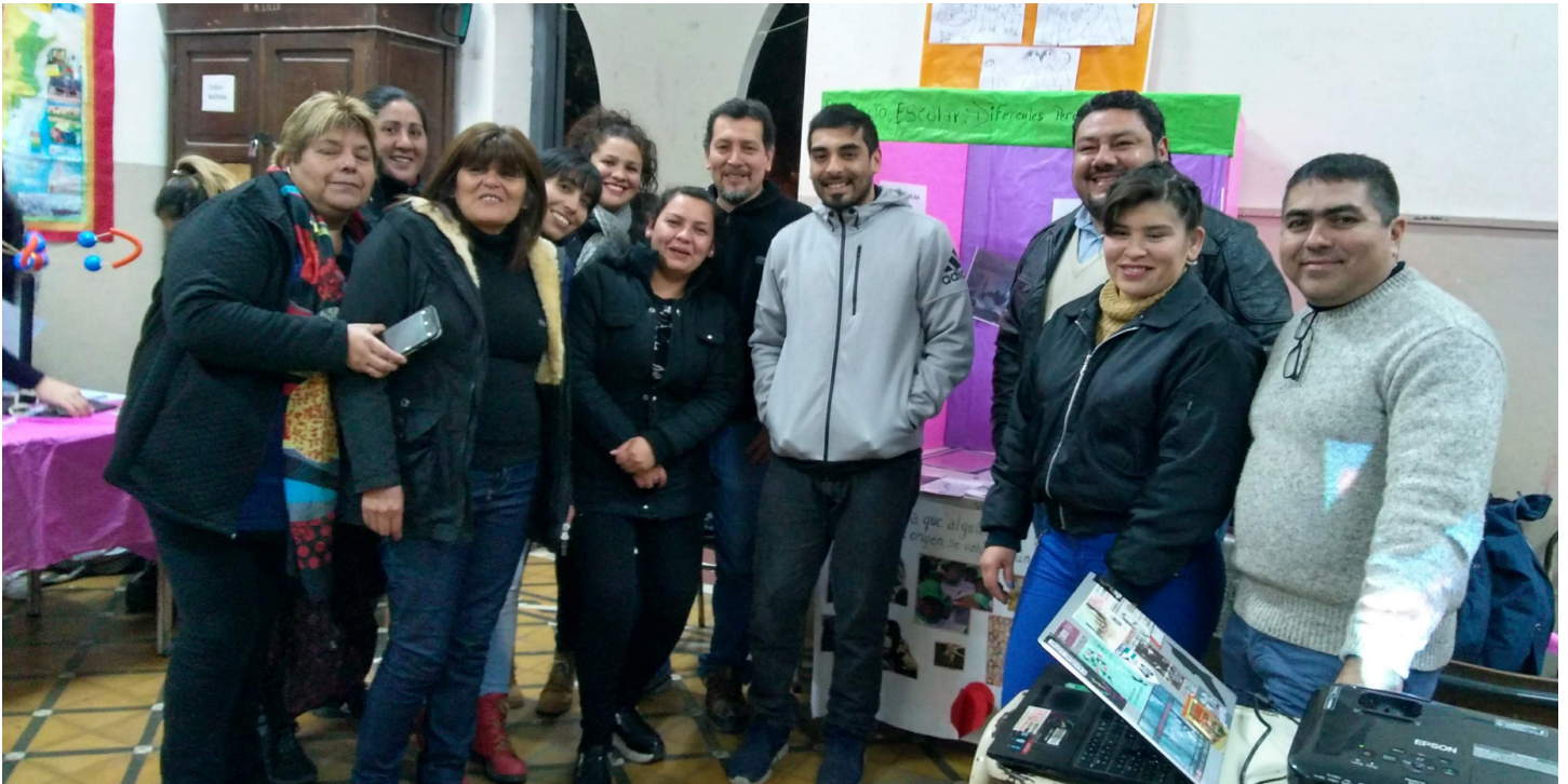
Escuela Silvano Bores | B° La Bombilla