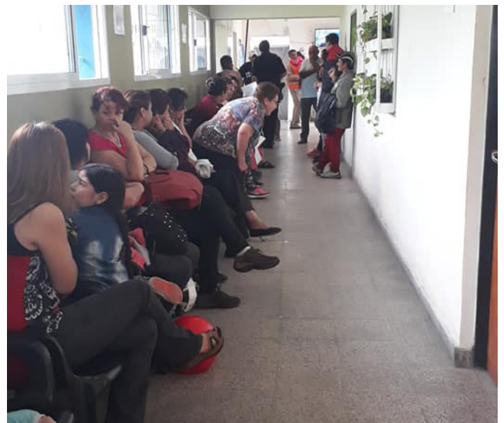
CIC "Creadores de Esperanza" | B° La Bombilla