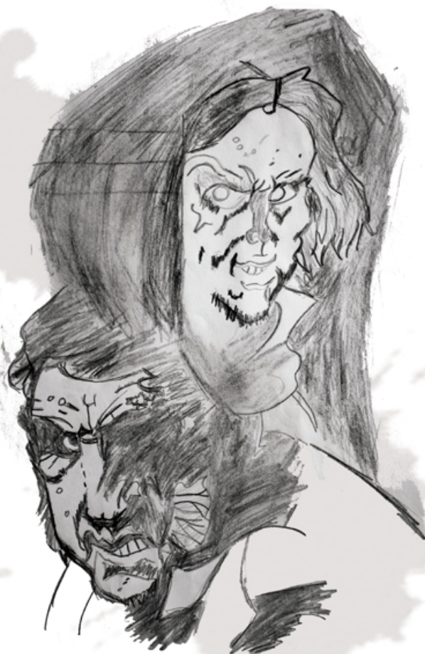
ILUSTRACION: FRÍAS JORGE

ENCONTRAR LA PAZ DESPUÉS DE TANTA TRISTEZA.