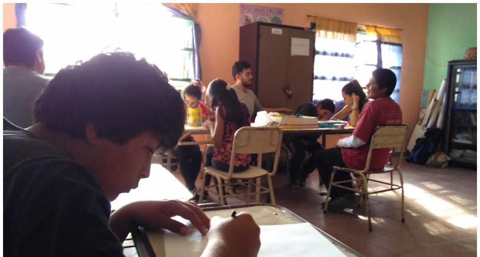
Escuela Tecnica Juan XXIII | B° Juan XXIII