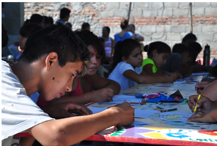
Merendero “Carita de Esperanza” | B° Juan XXIII

“La prevención en salud mental (...), posibilita abrir un camino simbólico frente a la fuerza de lo que no puede ser dicho. Es privilegiar la escucha sin imponer. Es poder generar un espacio interior que posibilite vislumbrar un más allá. Es el compromiso de un adulto con un niño. De los niños con otros niños, de uno a