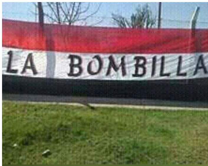
Cancha de futbol predio 911 | B° Juan XXIII