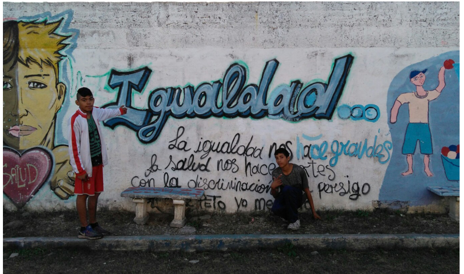
Grupo B | B° Juan XXIII