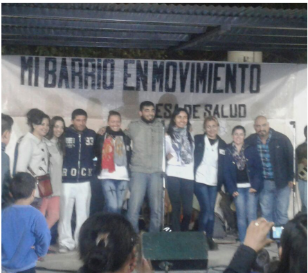
Mi Barrio en Movimiento | B° Juan Pablo II