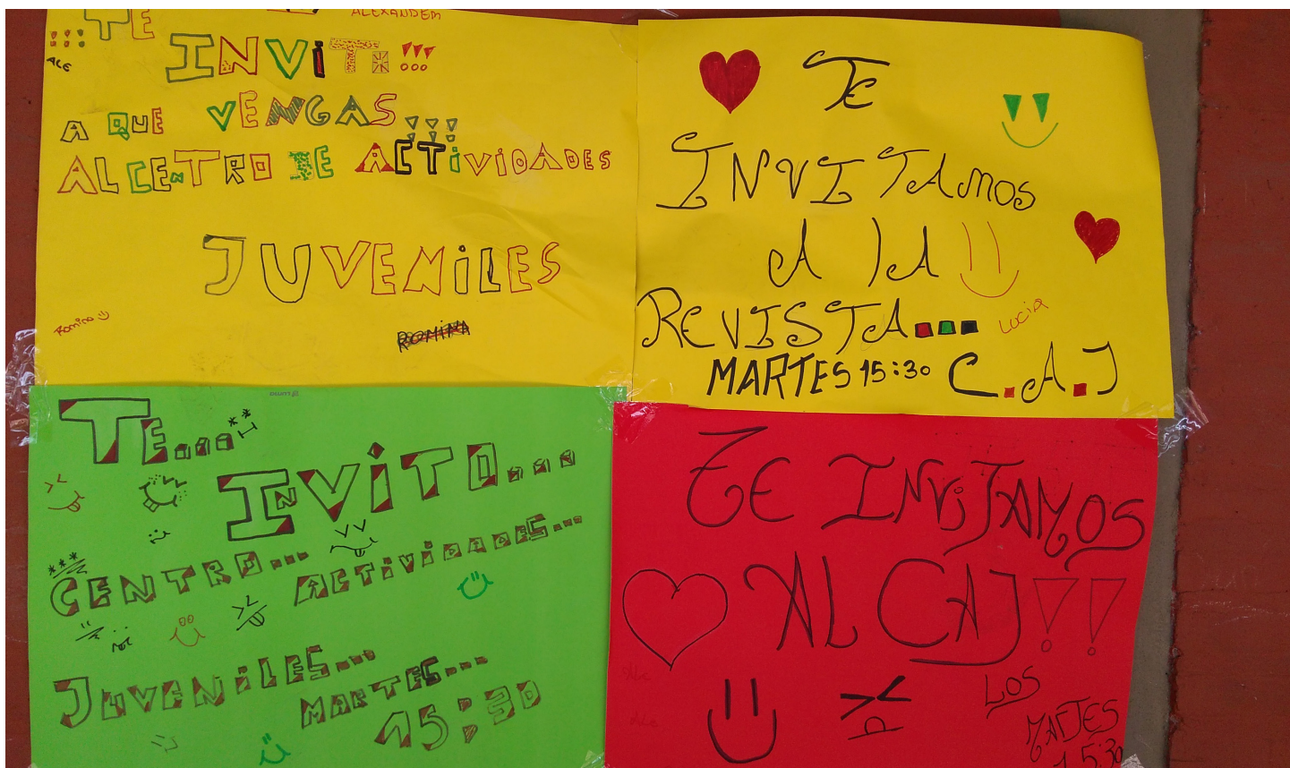
Escuela Técnica Juan XXIII | B° Juan XXIII

Son las diez de la mañana de un sábado cualquiera en La Bombilla.