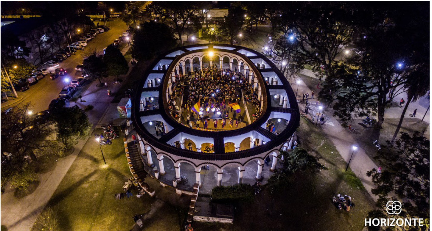
Murga Los TocaFondo | Parque Avellaneda