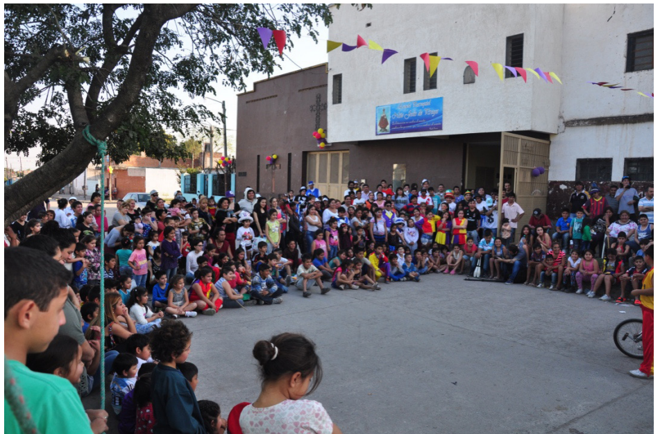
Festejos 10 años Los Tocafondos | B° Juan XXIII