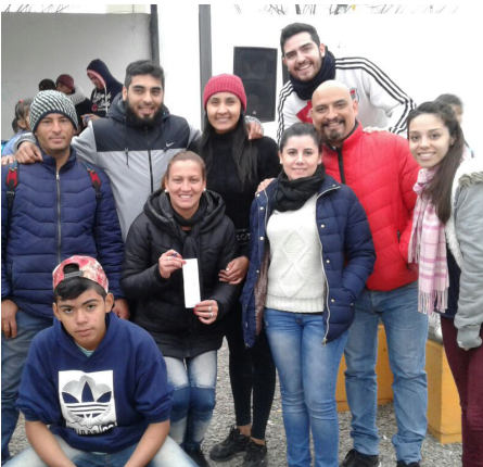
Mi Barrio en Movimiento | B° Juan Pablo II