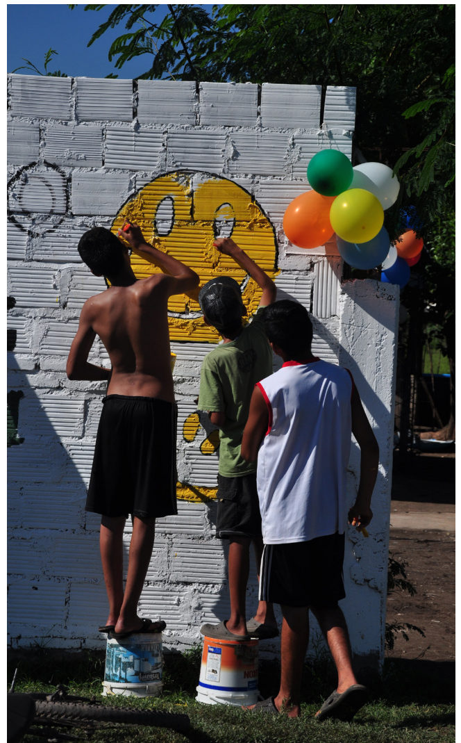
Merendero "Carita de Esperanza" | B° Juan XXIII