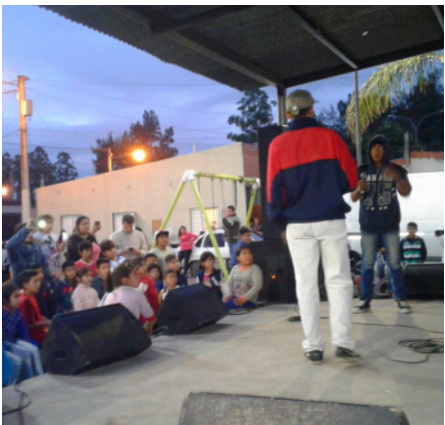
Grupo B | B° Juan Pablo II