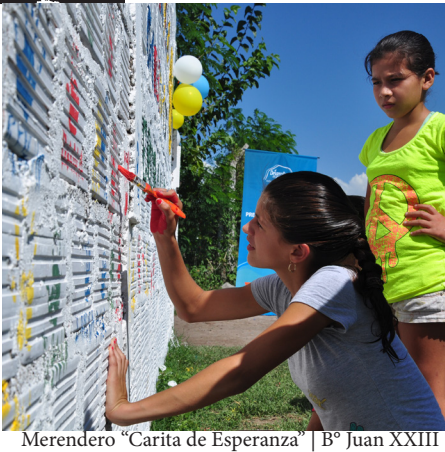
Merendero "Carita de Esperanza" | B° Juan XXIII