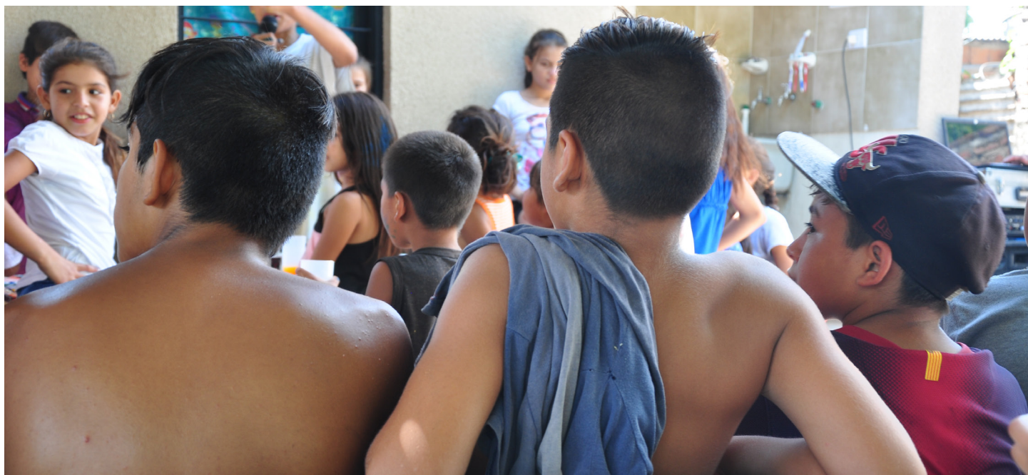
Merendero “Carita de Esperanza” | B° Juan XXIII

El equipo técnico, plantea el proyecto de revista comunitaria, para trabajar la prevención inespecífica en adicciones, de manera articulada con las instituciones educativas de la comunidad, fortaleciendo los espacios que ya existen en los barrios, como así también brindando nuevos espacios a los mismos.