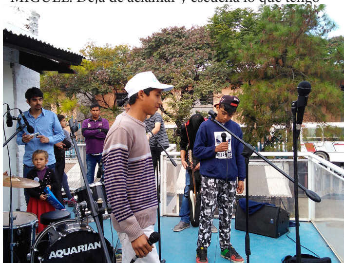
Ingenio Cultural | Ministerio de Desarrollo Social