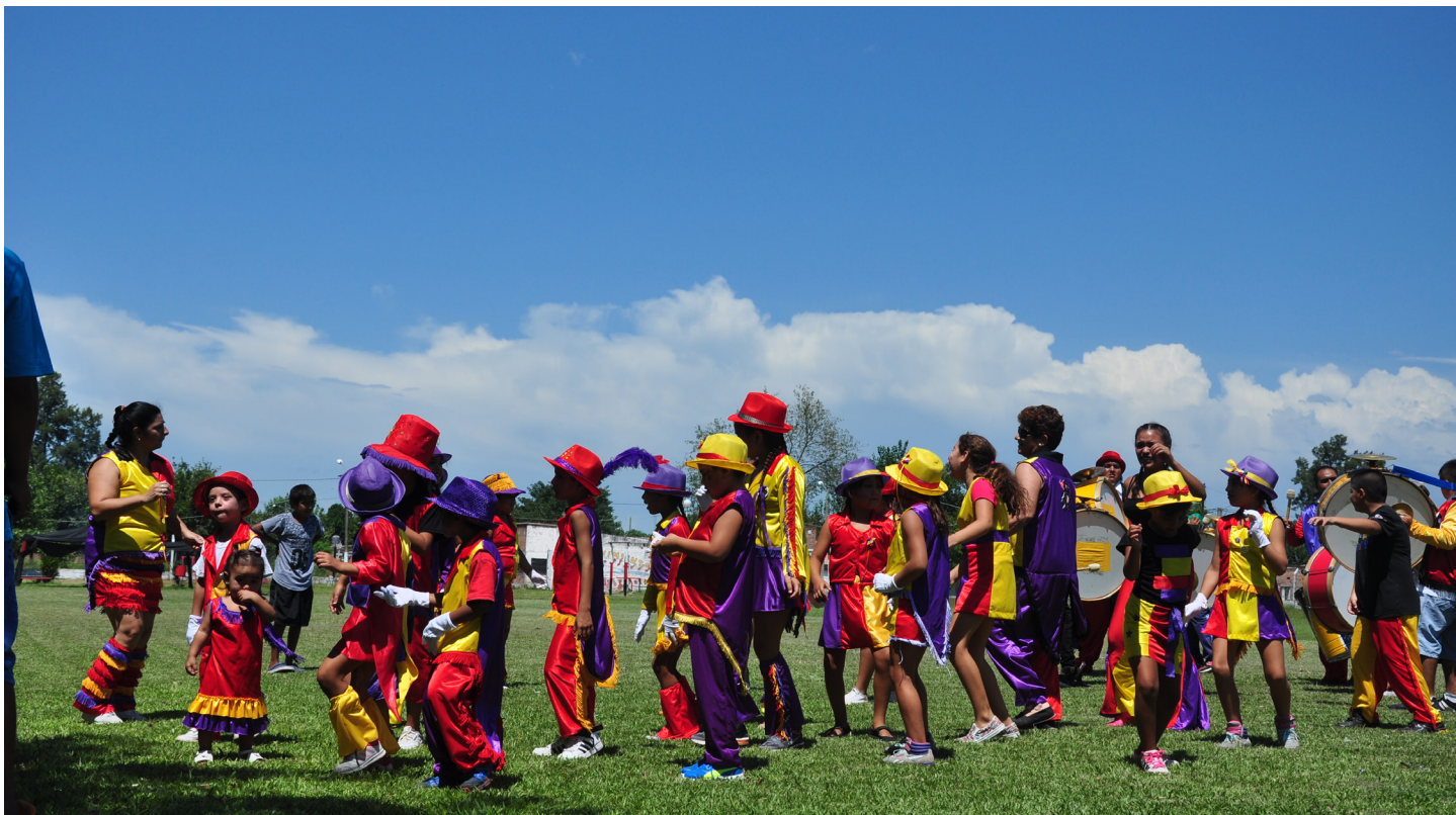
Murga Los TocaFondo | B° Juan XXIII