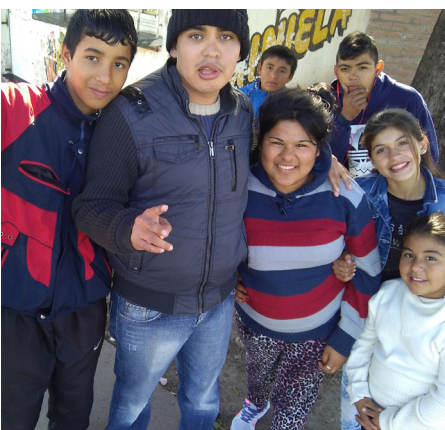
Ingenio Cultural | Ministerio de Desarrollo Social