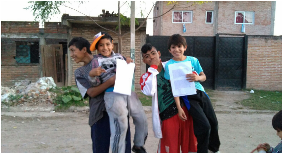
Calle Peru 1800 | B° Juan XXIII

En el mundo hay pobreza, vergüenza, falsedades, enfermedades y falsas promesas que giran y se quedan en tu cabeza; sin medir las consecuencias con tanta delincuencia, con tanta violencia con tantas ocasiones, situaciones malas acciones buscando provocaciones, cayendo en equivocaciones en tentaciones y en adicciones en situaciones de drogadiciones muertes sin explicaciones sin razones solo impactaciones, haciendo daño a nuestros corazones. Con tantas desapariciones, sin localizaciones, sin encontraciones lo que nos llevara a nuestra perdiciones. Es por eso yo rezo hago oraciones, hago oraciones para que Dios nos perdone, para que no nos abandone y que nos salve de nuestra imperfecciones y le pido que me guie en mi camino, así yo defino mi destino. Todos estos lamentos de estos putos momentos y me arrepiento yo no te miento en efecto vivimos con nuestros defectos nadie es perfecto. Aquí nadie es tu amigo, todos son enemigos yo estoy de testigo nadie le des la mano porque puede ser apuñalado, fíjate quien está a tu lado hermano sé que parece que estás perdido, herido no te des por vencido todavía no estas caído, no te sientas arrepentido, no estas derrotado sé que te han maltratado, pero no debes llorar debes pelear. Debes luchar, pelear y ganar. Nadie es diferente todos estamos presente, todos somos como