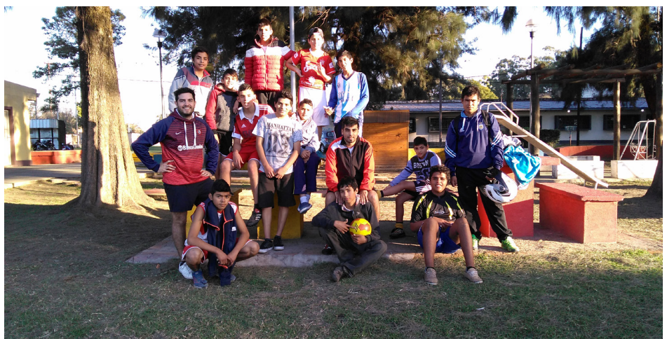
Espacio de Deportes | B° Juan Pablo II