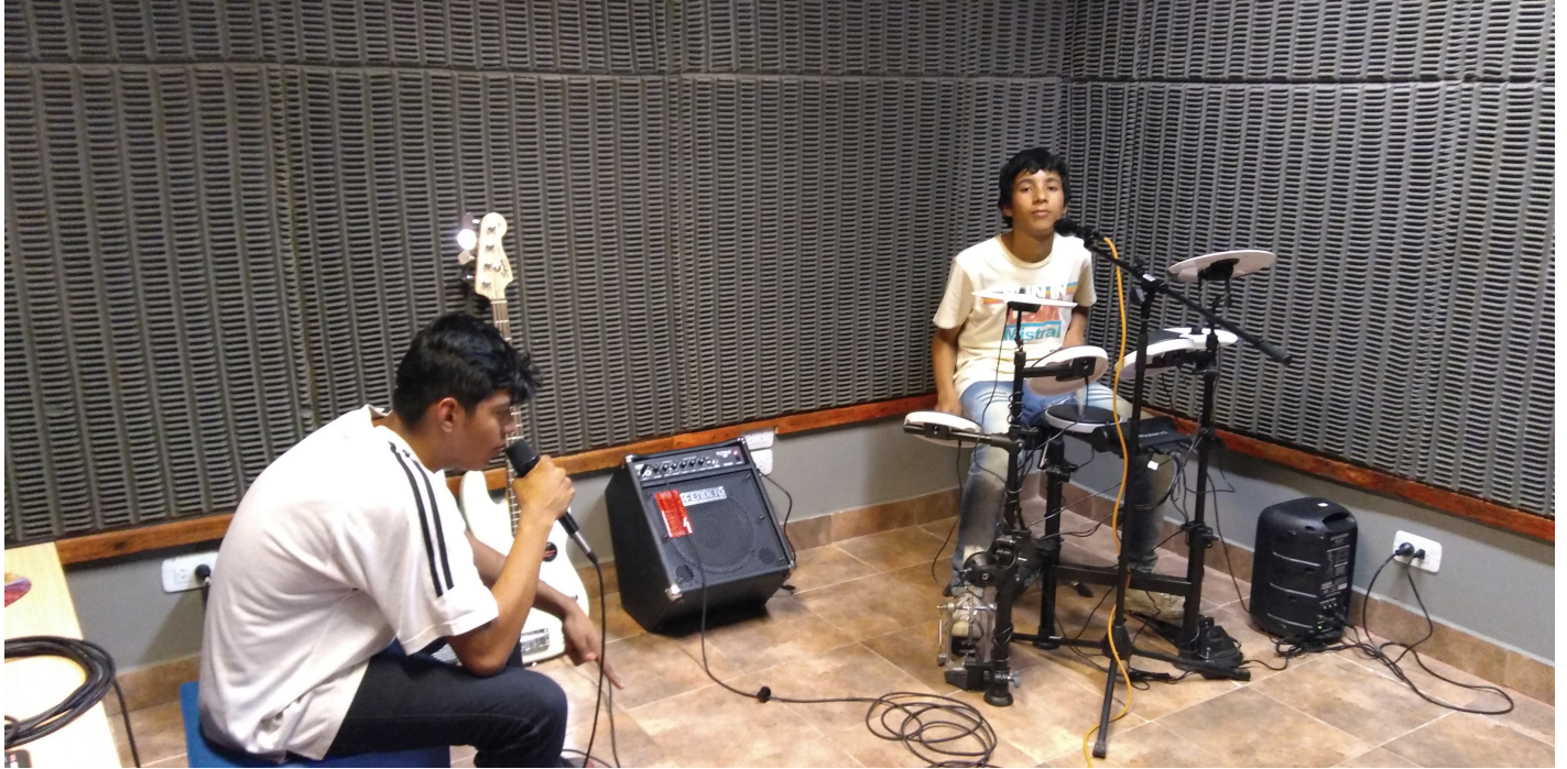
Ingenio Cultural | Ministerio de Desarrollo Social