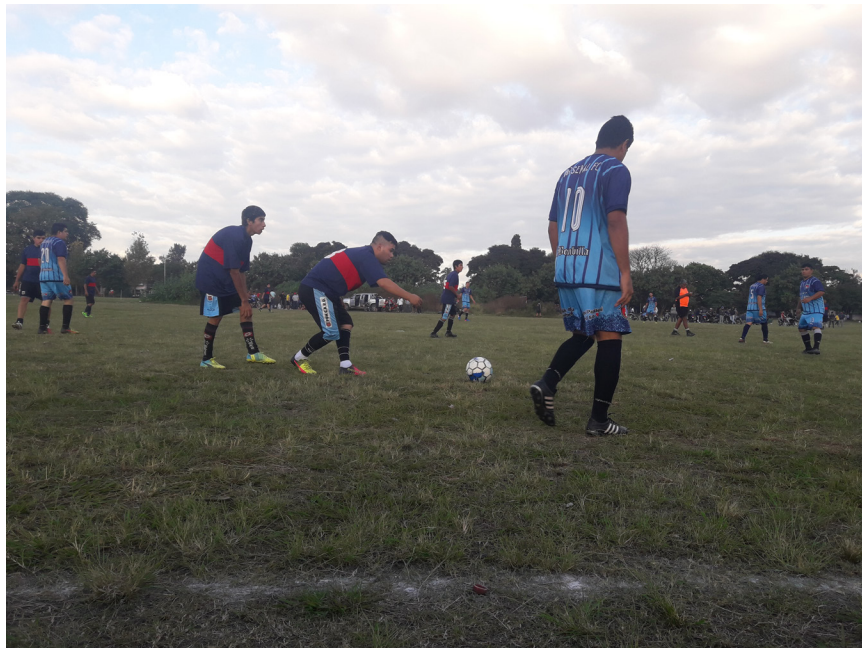
Cancha de futbol predio 911 | B° Juan XXIII