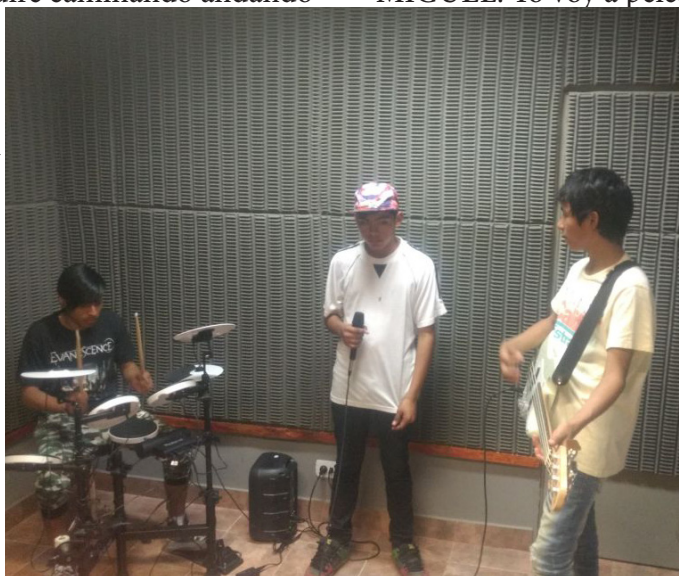
Ingenio Cultural | Ministerio de Desarrollo Social

ALBERTO: esta discusión no tiene sentido, ¿Por qué peleamos por una chica amigo?