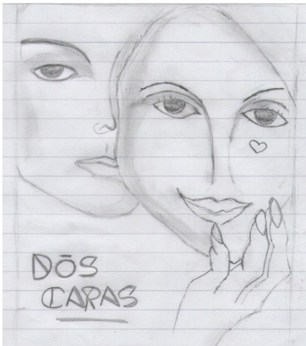
Ilustración: Samuel Galindez