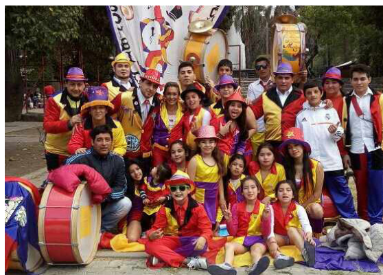
Murga Los TocaFondo | Parque Avellaneda

PROCESO, SINO SER ACTORES PARTICIPES DEL MISMO, EN BUSCA DE LA TRANSFORMACIÓN SOCIAL QUE TANTO ANHELAMOS PARA NUESTROS NIÑOS Y JÓVENES Y POR SUPUESTO, NUESTRO QUERIDO BARRIO, ES POR ESTO QUE EN ESTE 2017 CUMPLIMOS 11 AÑOS DE CARNAVAL Y DE TRABAJO SOCIO CULTURAL ININTERRUMPIDO. NUNCA ABANDONAREMOS LA CONVICCIÓN QUE SIEMPRE TUVI- MOS, DE QUE SOLO EN LAS BASES POPULARES, Y CON ELLAS, REALIZAREMOS ALGO SERIO, AUTENTICO Y TRANS- FORMADOR.