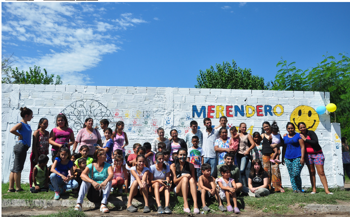
Merendero “Carita de Esperanza” | B° Juan XXIII

Los barrios Juan XXIII y Juan Pablo II (también conocidos como La Bombilla y El Sifón) han sido históricamente estigmatizados, desde siempre han tenido un lugarcito en la sección “policiales” de los medios masivos locales, legitimando la exclusión. Con esto quieren lograr culpar de la violencia, el caos social, el individualismo etcétera a los barrios populares y no dan espacio ni debate que permita pensar que lo que hay en los barrios es, justamente, producto de un fracaso del sistema. Sin embargo, hay gente que desde su acción individual y colectiva no solo luchan contra los tranzas, el hambre, el analfabetismo, entre otros puntos de una interminable lista de flagelos que caminan todos los días por las calles sin pavimentar del barrio, sino que además tienen la obligación de deconstruir la dolorosa mirada que la sociedad tiene hacia este sector.